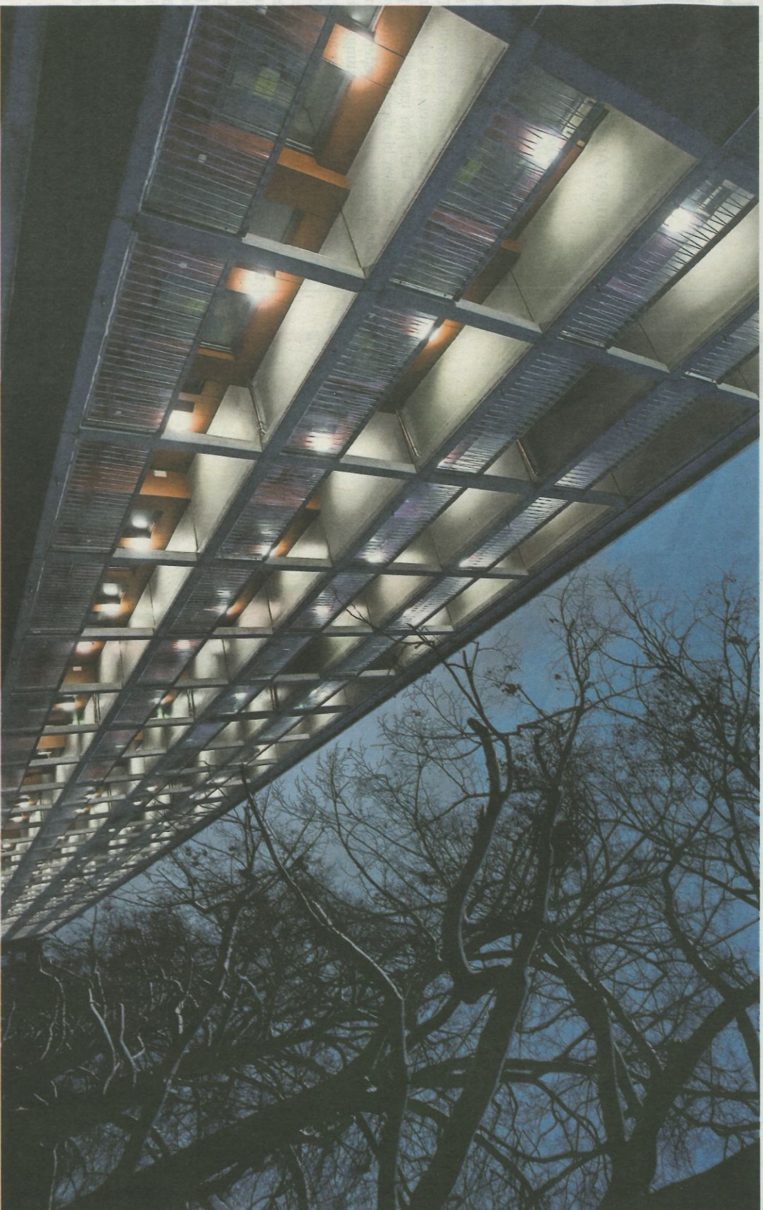
So schnell wurde in München noch nie geplant und gebaut: Mit vorgefertigten Teilen entstand innerhalb nur eines Jahres der sogenannte Stelzenbau über dem Parkplatz am Dantebad. Das Wohnhaus hat Vorbildcharakter für weitere Projekte.